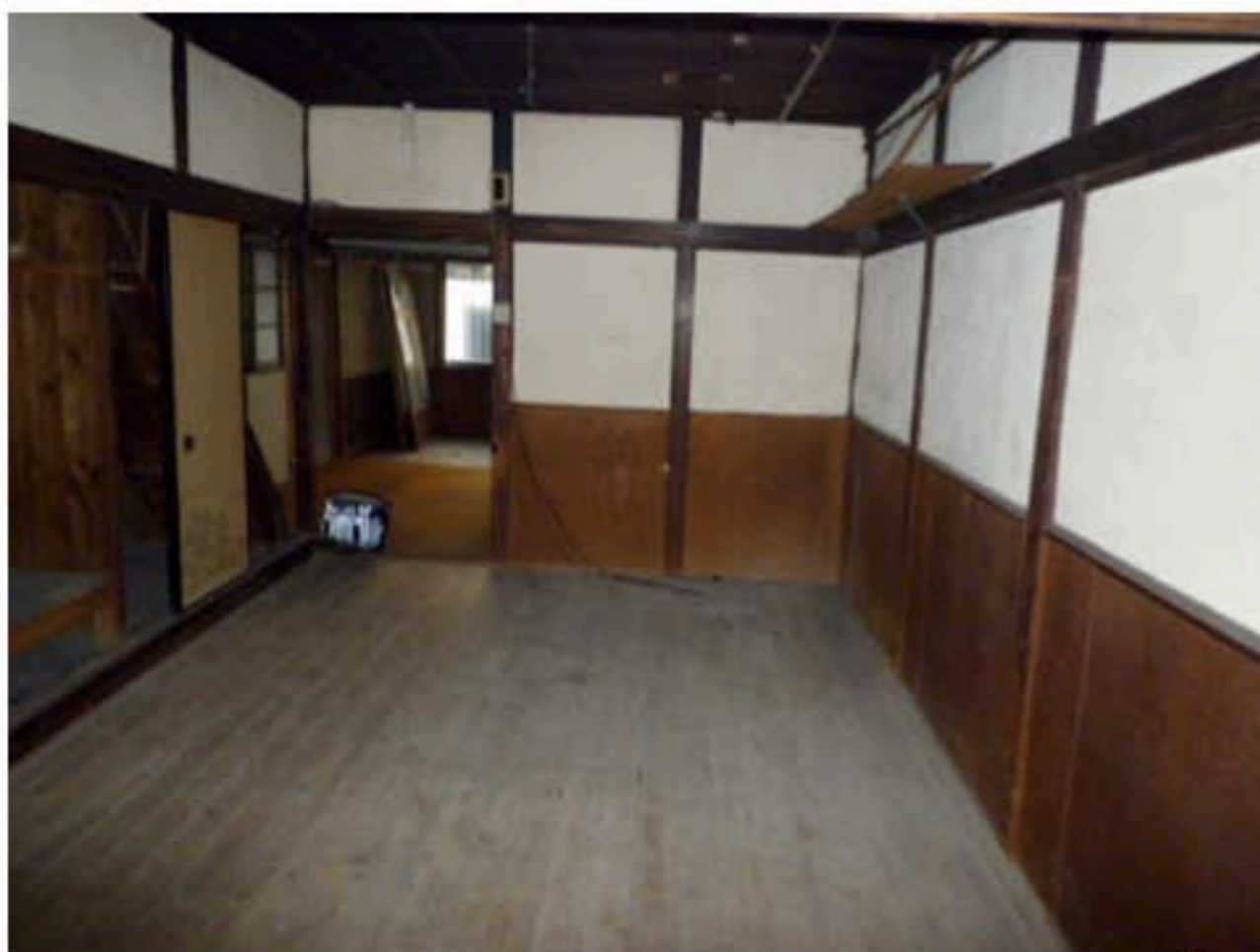
シェルター設置の部屋 (1階)