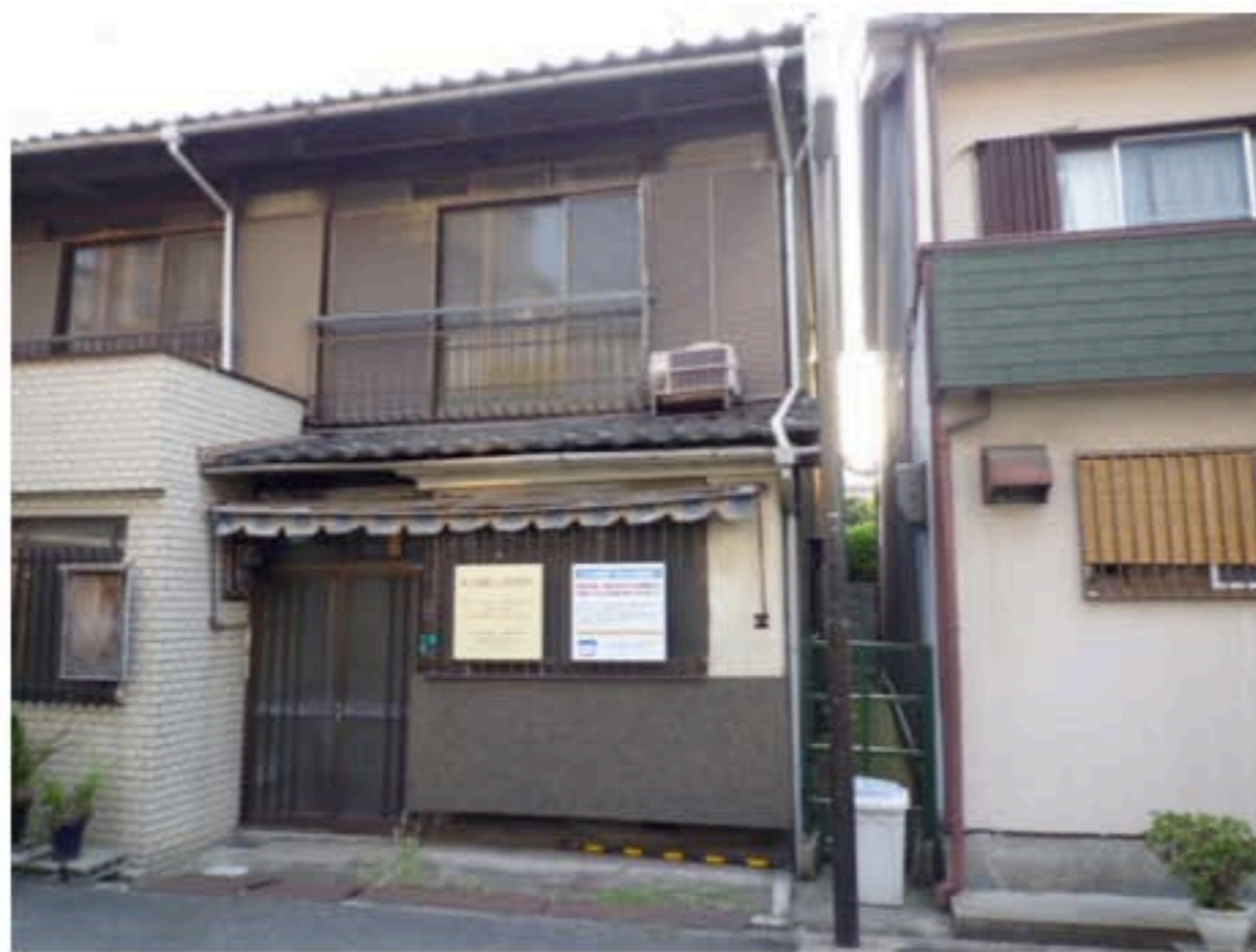
改修前の 長屋外観